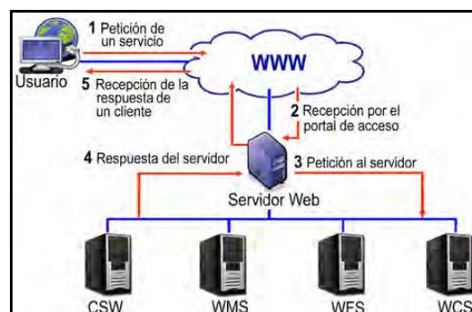
Figura 3. Funcionamiento de un servidor Web.

En la figura 3 se muestra esquemáticamente el funcionamiento de una aplicación Web en cuanto a la provisión de servicios de información.