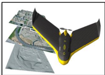
Figura 4. Dron eBee SenseFly.

Se recopilaron datos geográficos reales del área estudiada a través de la asistencia de un dron de cartografía: el Dron eBee SenseFly, que ha generado una imagen ráster del campus universitario para contar con la información más precisa posible respecto a las ubicaciones de las entidades geográficas (Fig.4). Esta herramienta de recolección de datos fue obtenida por medio de una solicitud de apoyo a este trabajo emitida a la unidad correspondiente de la entidad Itaipú Binacional.